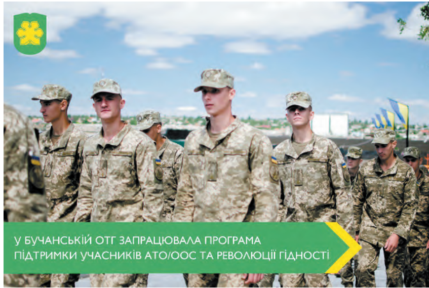
У БУЧАНСЬКІЙ ОТГ ЗАПРАЦЮВАЛА ПРОГРАМА ПІДТРИМКИ УЧАСНИКІВ АТО/ООС ТА РЕВОЛЮЦІЇ ГІДНОСТІ