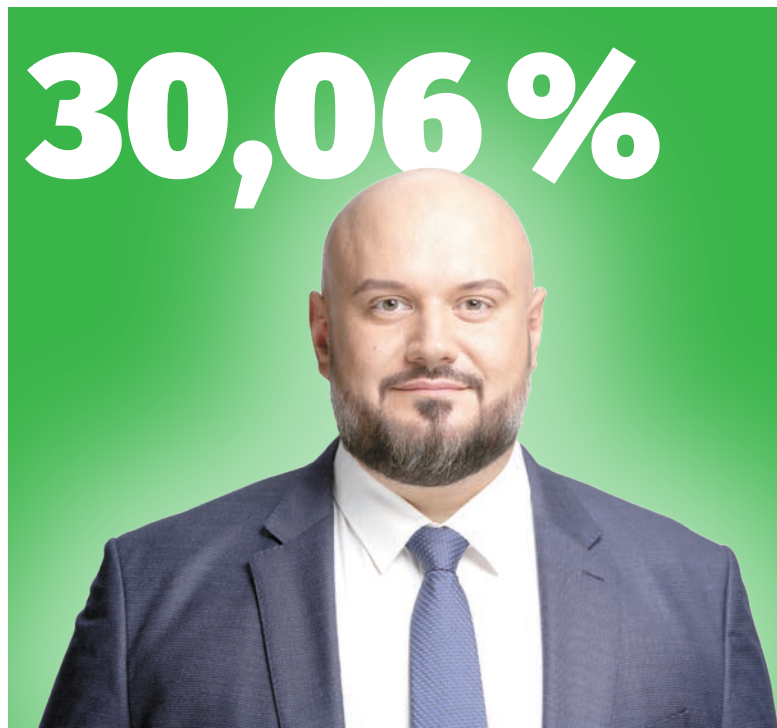
Горобець Олександр Сергійович, політична партія «СЛУГА НАРОДУ»