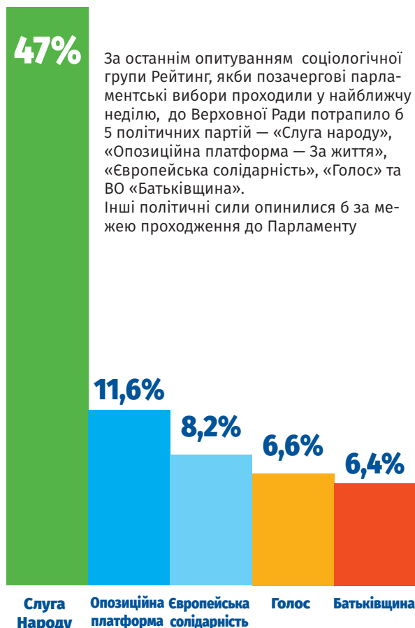
Група Рейтинг. Моніторинг електоральних настроїв українців 6-10 липня 2019 року