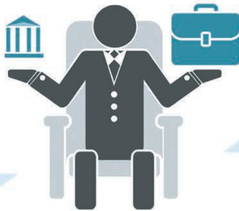
Депутат місцевої ради